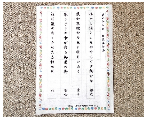
花笑み句会の作品