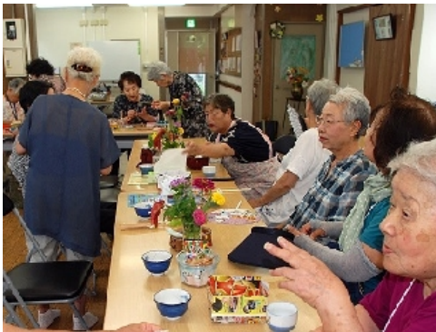
そろそろランチタイム1

隣接の障害者施設で開催される行事に、バザー小物品として出す予定の竹細工を講師の方による指導の下で作製中です。写真右上は完成品 美しく綺麗な作品です。