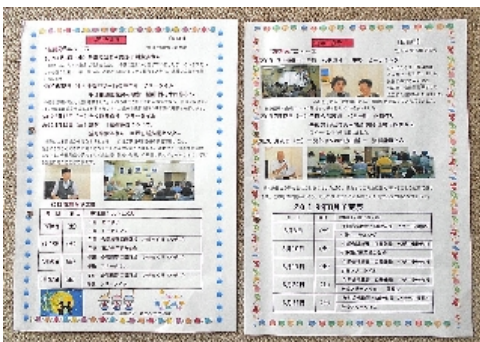
花笑みニュース、6月号と7月号

そろそろランチタイムです。いい香りのカレーライスが運ばれています。私もご馳走になりました、大変美味しかったです。