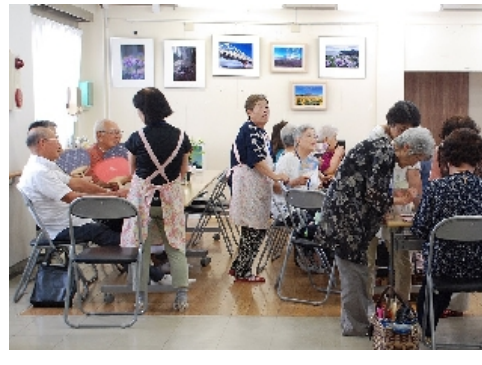
そろそろランチタイム2

そろそろランチタイムです。いい香りのカレーライスが運ばれています。私もご馳走になりました、大変美味しかったです。