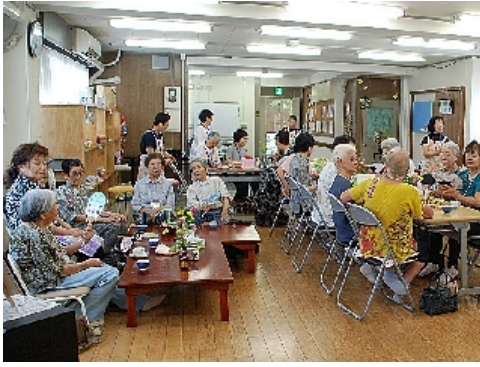
お茶をしながらのおしゃべりタイム